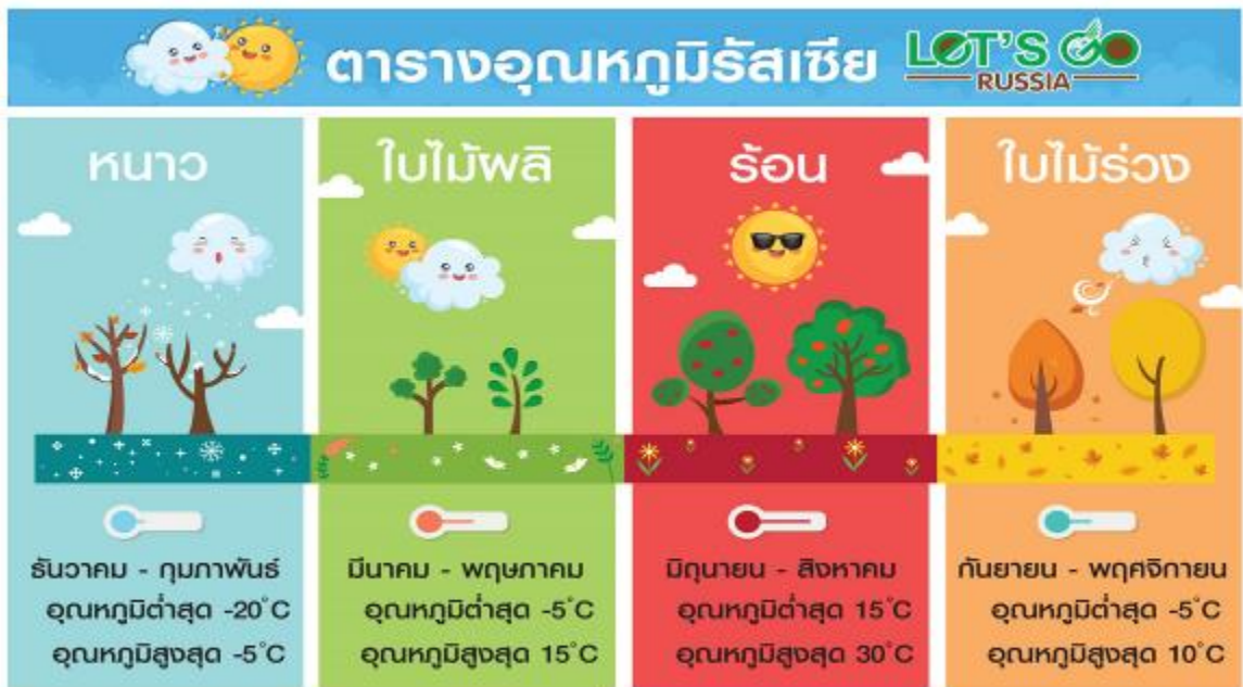
** อุณหภูมิเฉลี่ยโดยประมาณ **

06.10 น. เดินทางถึง ท่าอากาศยานนานาชาติโดโมเดโดโว เมืองมอสโก ประเทศรัสเซีย นำท่านผ่านพิธีการตรวจคนเข้าเมืองและศุลกากร ** เวลาท่องเที่ยวในประเทศไทยประมาณ 4 ชั่วโมง ** นำท่านเดินทางสู่ เมืองมอสโก (Moscow) เป็นเมืองหลวงของประเทศรัสเซีย มีประวัติศาสตร์ยาวนานถึง 850 ปี เป็นศูนย์กลางทางเศรษฐกิจ การเงิน การศึกษา และการเดินทางของประเทศ โดยตั้งอยู่ใกล้แม่น้ำมัสกวา ซึ่งในตัวเมืองมีประชากรอยู่อาศัยกว่า 1 ใน 10 ของประเทศ ทำให้เป็นเมืองที่มีประชากรหนาแน่นที่สุดในยุโรป และเมื่อสมัยครั้งที่สหภาพโซเวียตยังไม่ล่มสลาย เมืองมอสโกก็ยังคงเป็นเมืองหลวงของสหภาพโซเวียตอีกด้วย