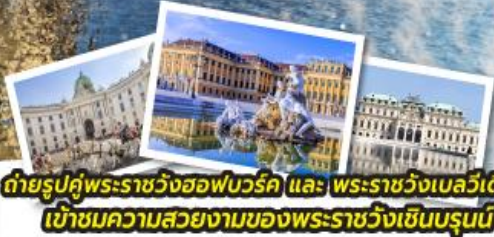
ถ่ายรูปคู่พระราชวังฮอฟบวร์ค และ พระราชวังเบลเวเดียร์ เข้าชมความสวยงามของพระราชวังเซ็นบรุนน์