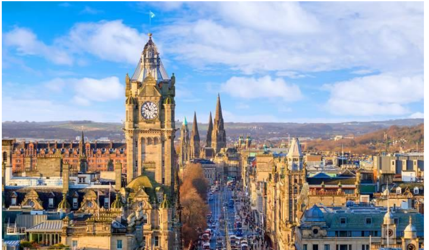
นำท่าน ชม โบสถ์เซนต์ ใจลส์ (St. Giles Cathedral) เป็นวิหารเก่าแก่แห่งเมืองเอดินเบิร์ก สร้างมาตั้งแต่สมัยศตวรรษที่ 12 เป็นวิหารในศาสนาคริสต์นิกายโรมันคาทอลิก บริเวณด้านหน้าเป็นที่ตั้งของ อนุสาวรีย์ของ พระเจ้าชาร์ลที่ 2 (Charles II of England) ส่วนด้านนอกอีกฝั่งหนึ่งเป็นที่ตั้งของ อนุสาวรีย์อดัม สมิธ (Adam Smith) ชาวสกอตแลนด์ ซึ่งได้รับยกย่องให้เป็น บิดาแห่งเศรษฐศาสตร์ ผู้กำหนดแนวคิดเศรษฐศาสตร์ตลาดเสรี และเกิดการเปลี่ยนแปลงการค้าครั้งใหญ่ในทวีปยุโรป